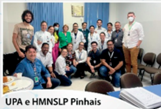
UPA e HMNSLP Pinhais Selo ONA 1 Acreditado